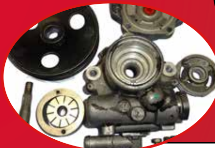
Części zdemontowane lub nieobecne