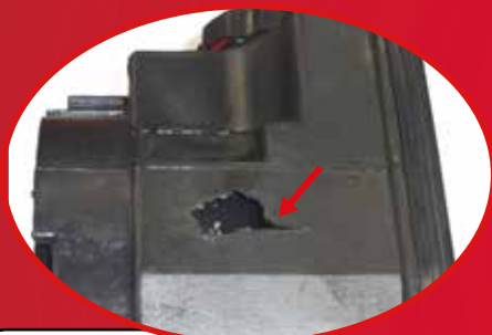
Uszkodzona rura wlotowa lub zbiornik