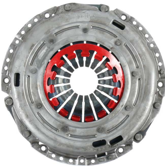
Ilustracja 4: Przesunięcie dodatkowej sprężyny membranowej

Więcej informacji serwisowych można znaleźć tutaj: www.zf.com/serviceinformation