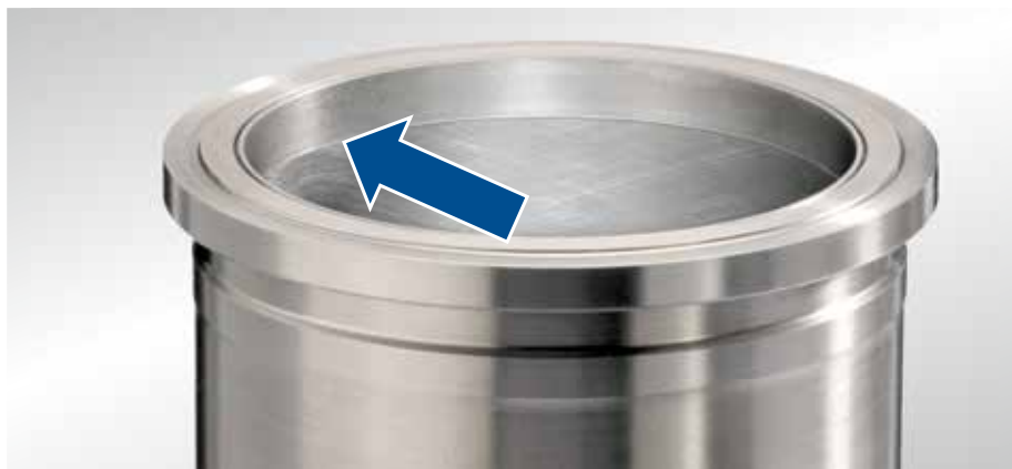
Rys. 1 Tuleja bieżna cylindra, Actros

Informacja dodatkowa Mimo dość ścisłego osadzenia tulei bieżnych cylindrów w otworze, wskutek ciśnienia spalania i sił bocznych przenoszonych przez tłok w czasie pracy silnika dochodzi do mikroruchów. Po dłuższej eksploatacji ruchy te powodują wgrzybenie się kołnierza tulei w obudowę silnika. Zmiany konstrukcyjne mają na celu zmniejszenie zużycia silnika. Tylko w ten sposób można zapewnić pojazdom użytkowym wymagany przebieg eksploatacyjny, wynoszący ponad milion kilometrów.